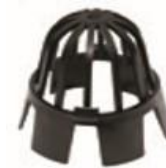
Coladera para sólidos