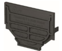
Tapa de cierre